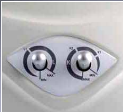
Potentiometer Lux & Kelvin